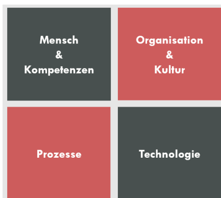
Abbildung 1: Fokusfelder der digitalen Transformation

Digitale Transformation (auch „digitaler Wandel“) bezeichnet einen fortlaufenden, in digitalen Technologien begründeten Veränderungsprozess, der in wirtschaftlicher Hinsicht speziell auf Unternehmen ausgerichtet ist.